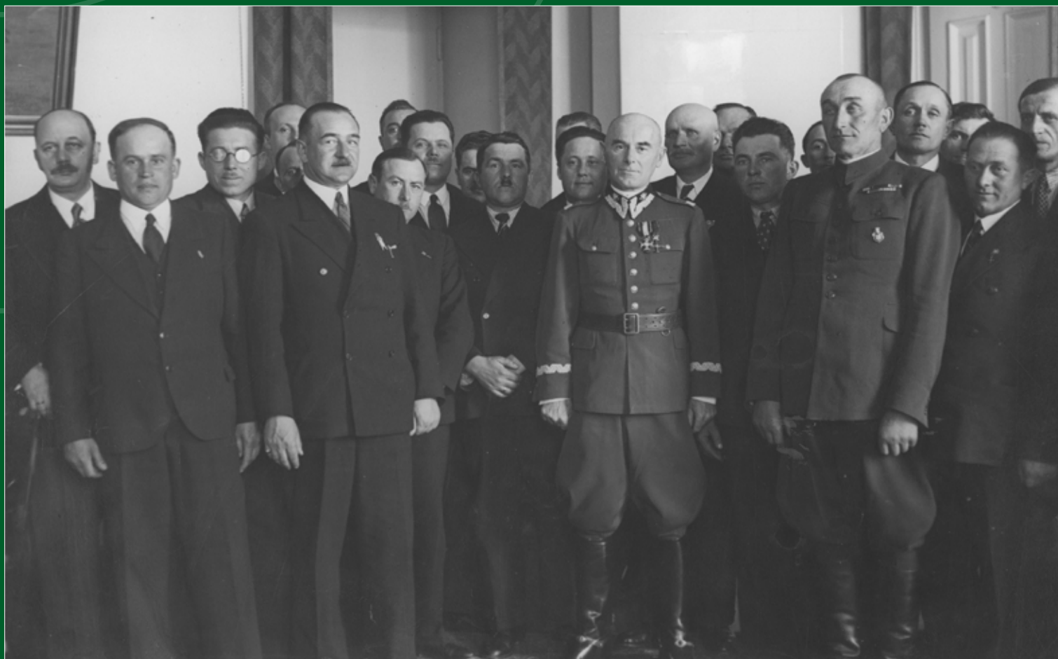
Spotkanie delegatów Rady Naczelnej ZGW z marszałkiem Edwardem Rydzem-Śmigłym, Warszawa, 20.04.1937 r.

Ostatni przed 1939 rokiem IV Zjazd Związku odbył się w Warszawie 24 czerwca 1932 roku. Na Zjeździe przyjęto nowy statut, w którym wyeliminowano Zjazd Ogólny,