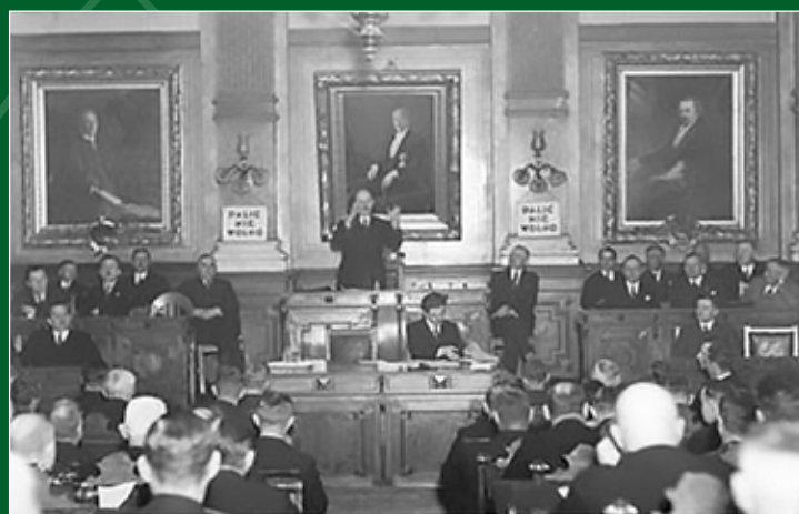
Zjazd Związku Gmin Wiejskich RP województwa poznańskiego, 30.03.1936 r.