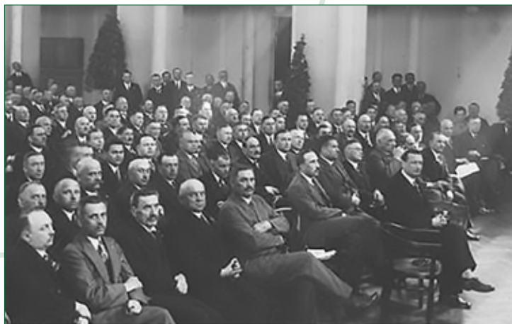
Zjazd Związku Gmin Wiejskich RP w Poznaniu 29.04.1934 r.