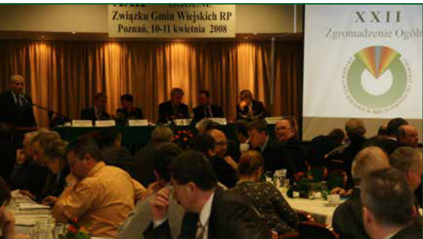
Zdjęcia z wybranych wydarzeń XXII Zgromadzenie Ogólne ZGW RP w Poznaniu IX Kongres Gmin Wiejskich RP w Warszawie