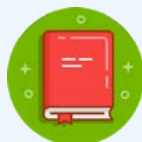
czytanie ze zrozumieniem