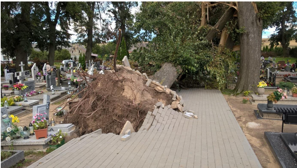
Zdjęcie 17. Stan po nawałnicy: uszkodzony chodnik z kostki brukowej