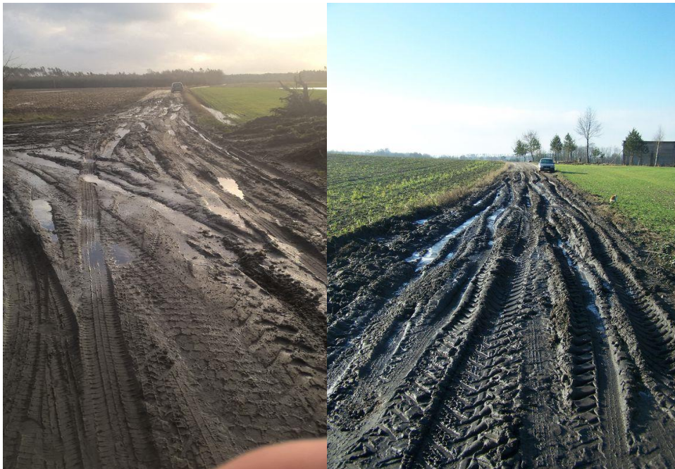
Zdjęcie 6. Drogi w Skoraczewie