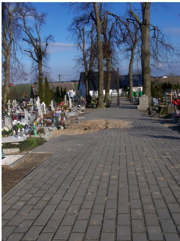
Zdjęcie 19. Stan aktualny: zniszczone drzewa zostały usunięte ubytki w chodniku zostały czasowo zasypane