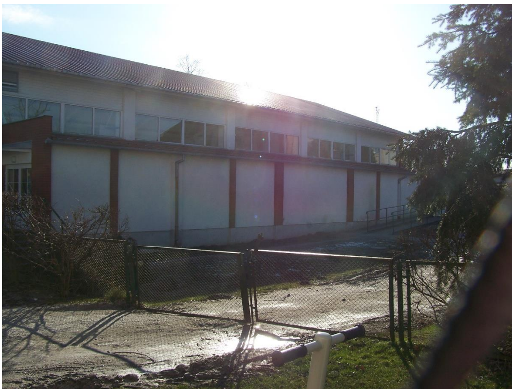
Zdjęcie 13. Stan aktualny sali gimnastycznej w Sośnie: naprawione poszycie dachowe