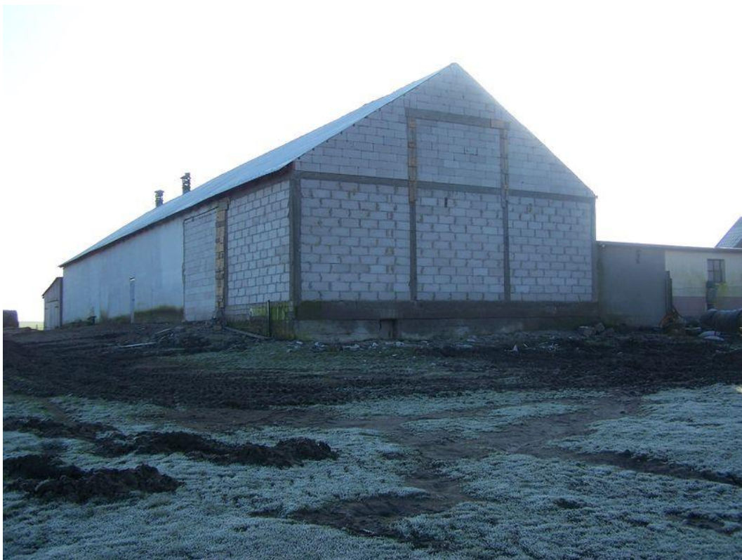
Zdjęcie 22. Stan aktualny w trakcie odbudowy