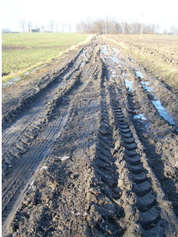
Zdjęcie 5. Droga w Rogalinie