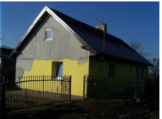
Zdjęcie 24. Stan aktualny po odbudowie dachu i remoncie wnętrza