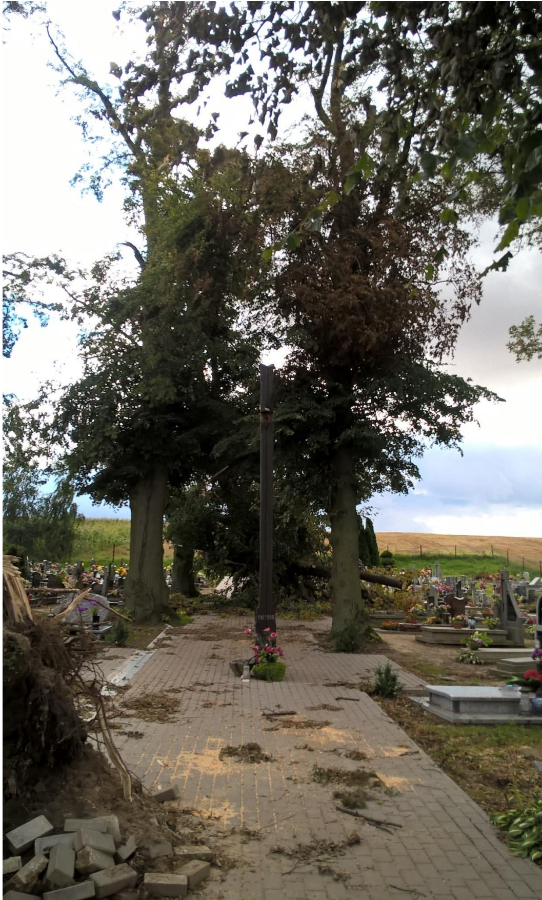
Zdjęcie 18. Stan po nawałnicy: uszkodzony krzyż oraz chodnik z kostki brukowej