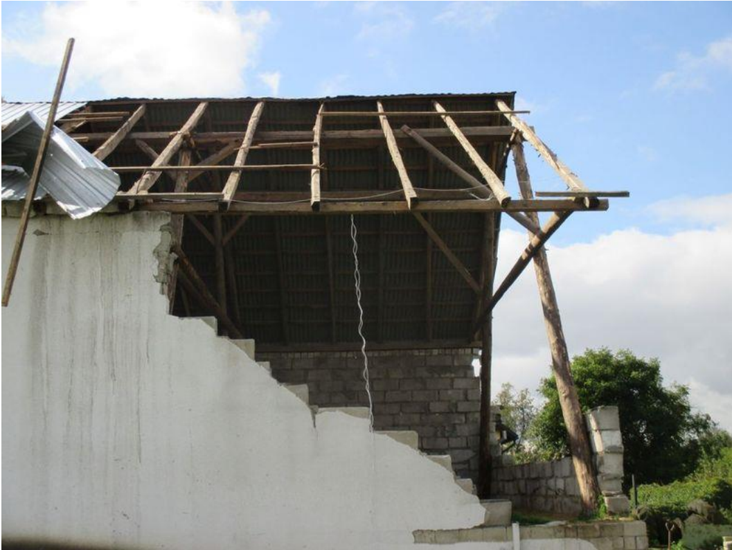
Zdjęcie 21. Stan po nawalnicy: zerwane poszycie dachowe oraz obalone ściany nośne