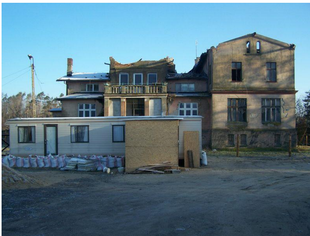
Zdjęcie 2. Stan aktualny: na pierwszym planie mieszkanie zastępcze w postaci domku holenderskiego