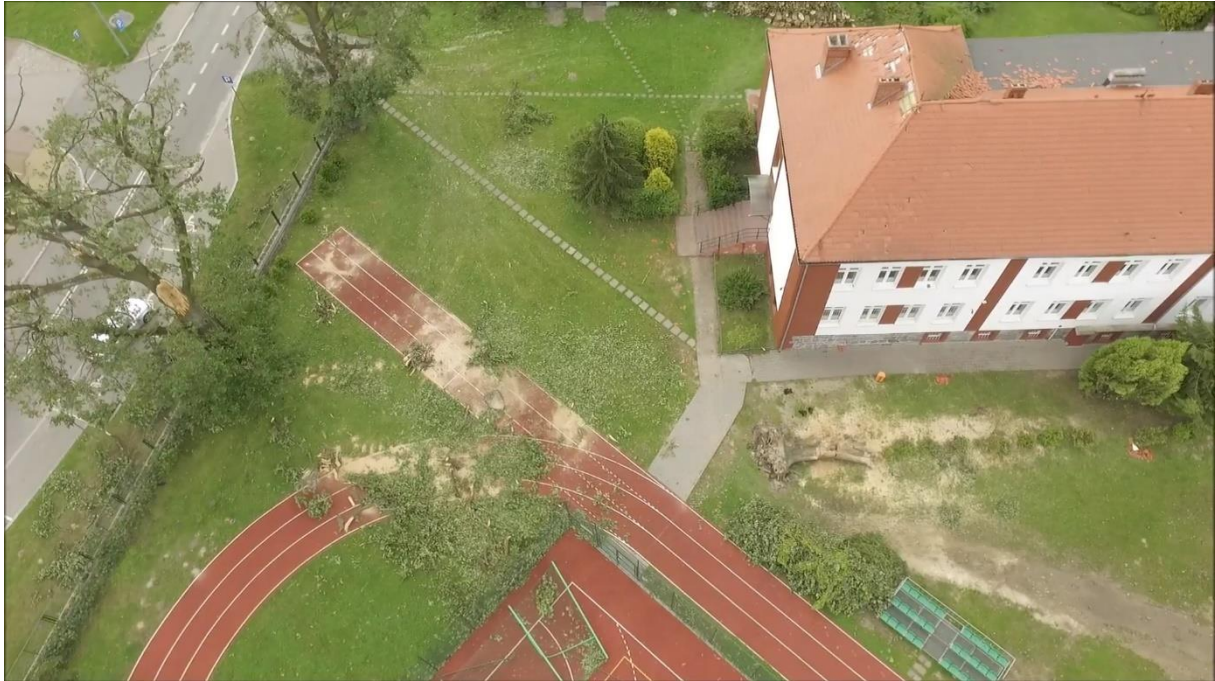
Zdjęcie 11. Uszkodzenia po nawałnicy: uszkodzony dach SP oraz zniszczona infrastruktura boiska