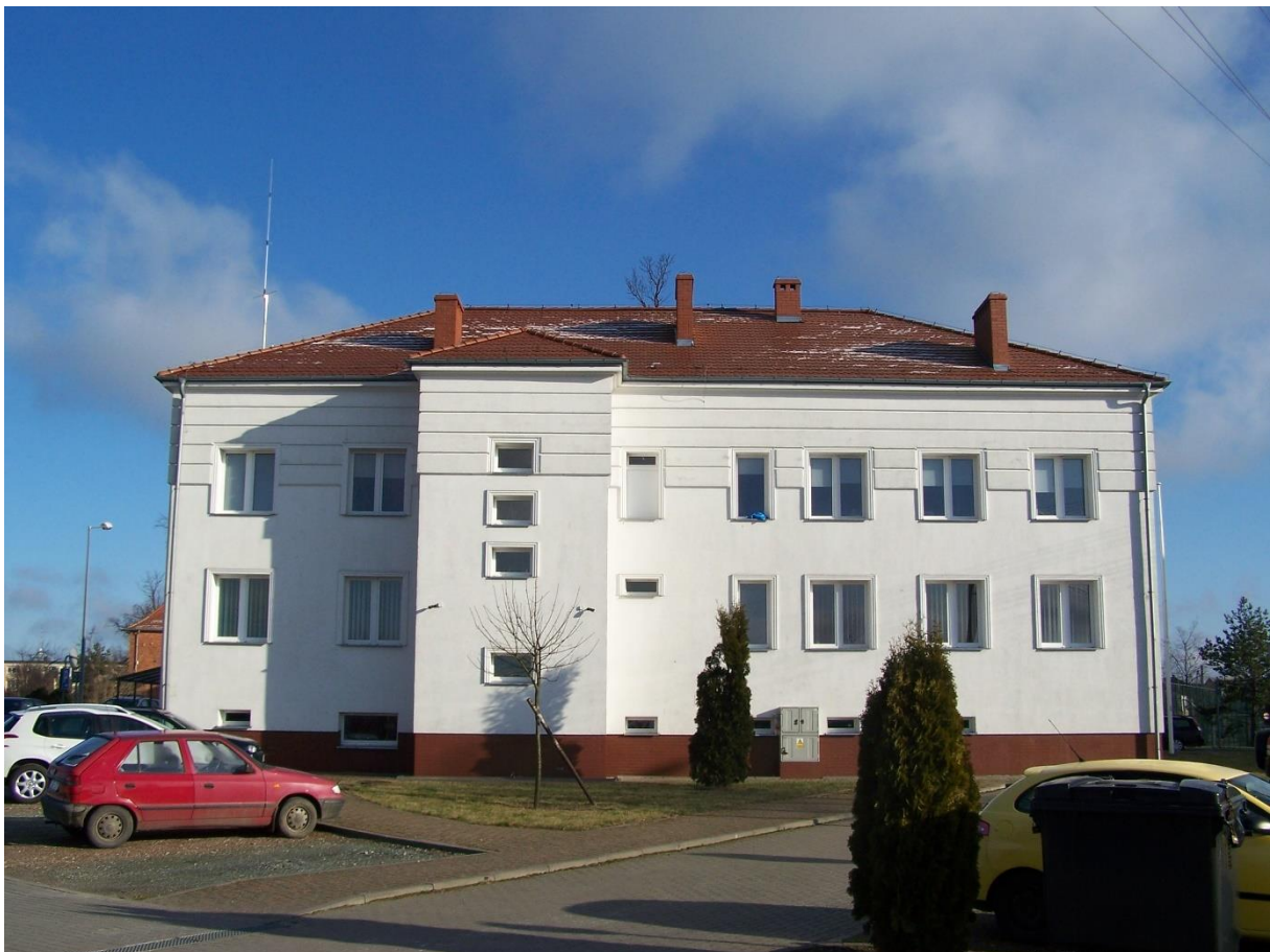
Zdjęcie 8. Stan aktualny po remoncie poszycia dachowego