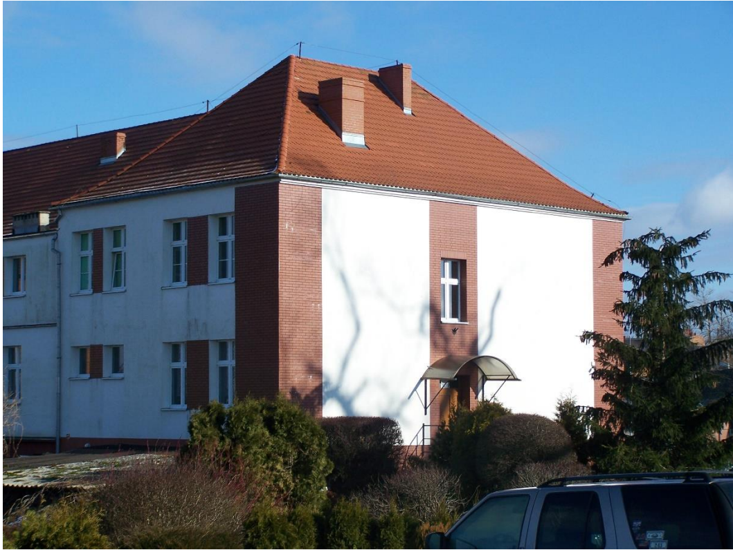
Zdjęcie 15. Stan aktualny SP w Sośnie: naprawione poszycie dachowe