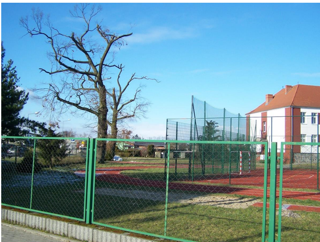
Zdjęcie 14. Aktualny stan boiska w Sośnie: naprawiona bieżnia oraz piłkochwyt