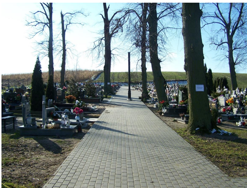
Zdjęcie 20. Stan aktualny: uszkodzony krzyż, kostka brukowa do uzupełnienia