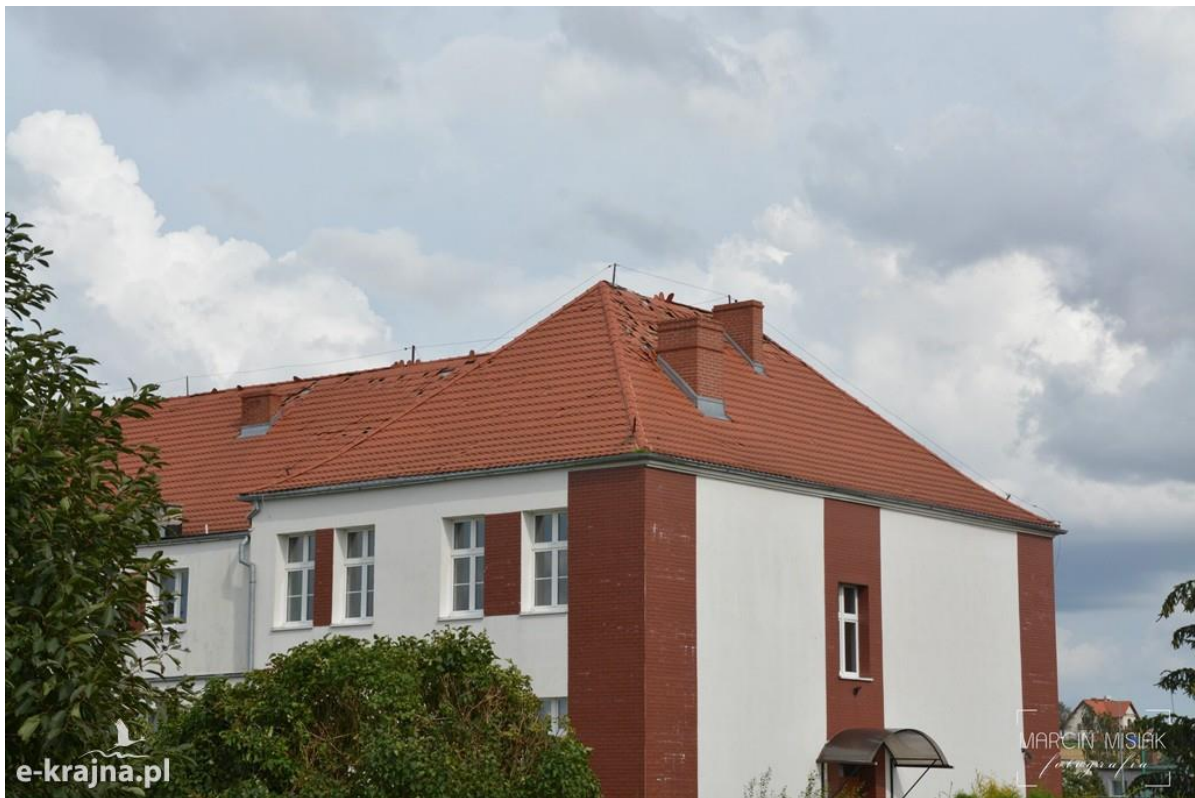
Zdjęcie 10. Stan po nawałnicy: uszkodzone poszycie dachowe w budynku SP