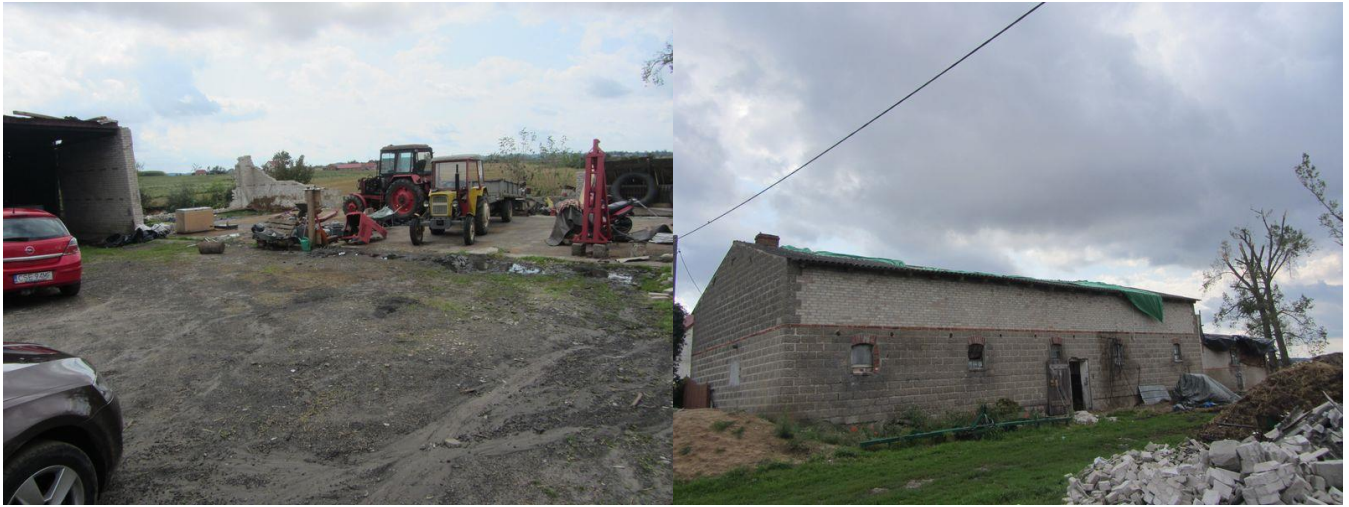
Zdjęcie 26. Stan po nawałnicy doszczętnie zniszczony budynek gospodarczy po którym została tylko posadzka oraz uszkodzony dach chlewni