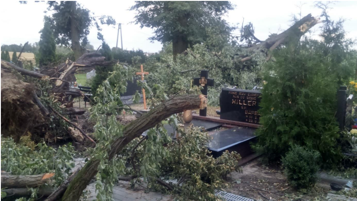
Zdjęcie 16. Stan po nawałnicy: zniszczone nagrobki przez powalone drzewa