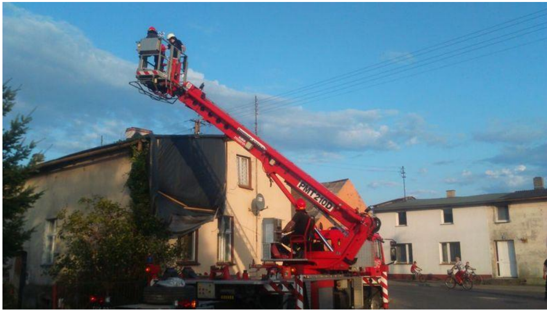
Zdjęcie 3. Stan po nawałnicy zerwane poszycie dachowe oraz uszkodzona ściana nośna