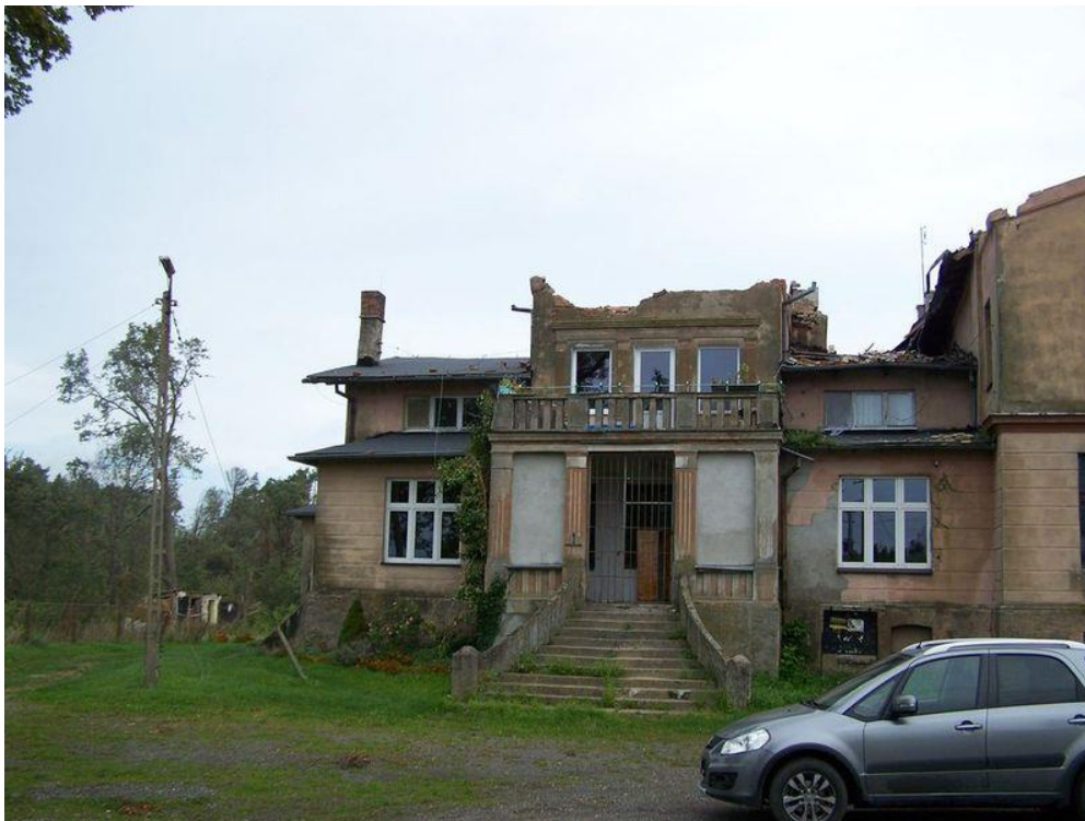
Zdjęcie 1. Stan po nawałnicy: zerwane poszycie dachowe wraz z konstrukcją oraz uszkodzone ściany