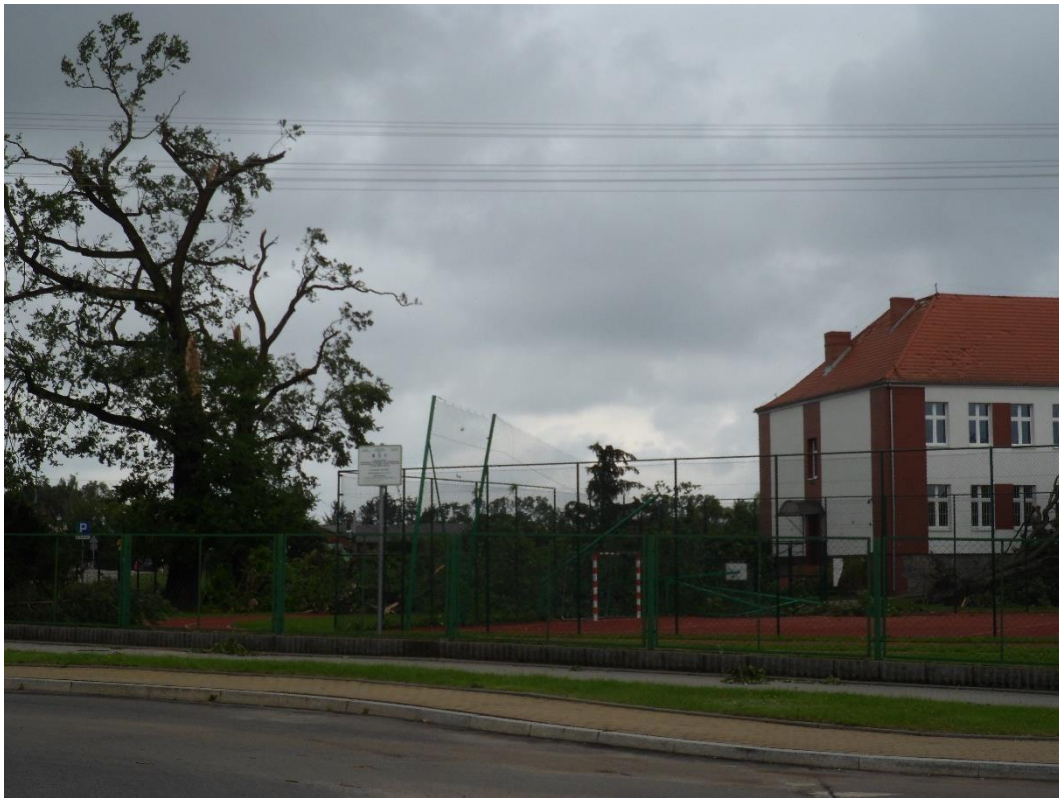
Zdjęcie 9. Stan po nawałnicy: zniszczona infrastruktura boiska oraz poszycia dachowego SP