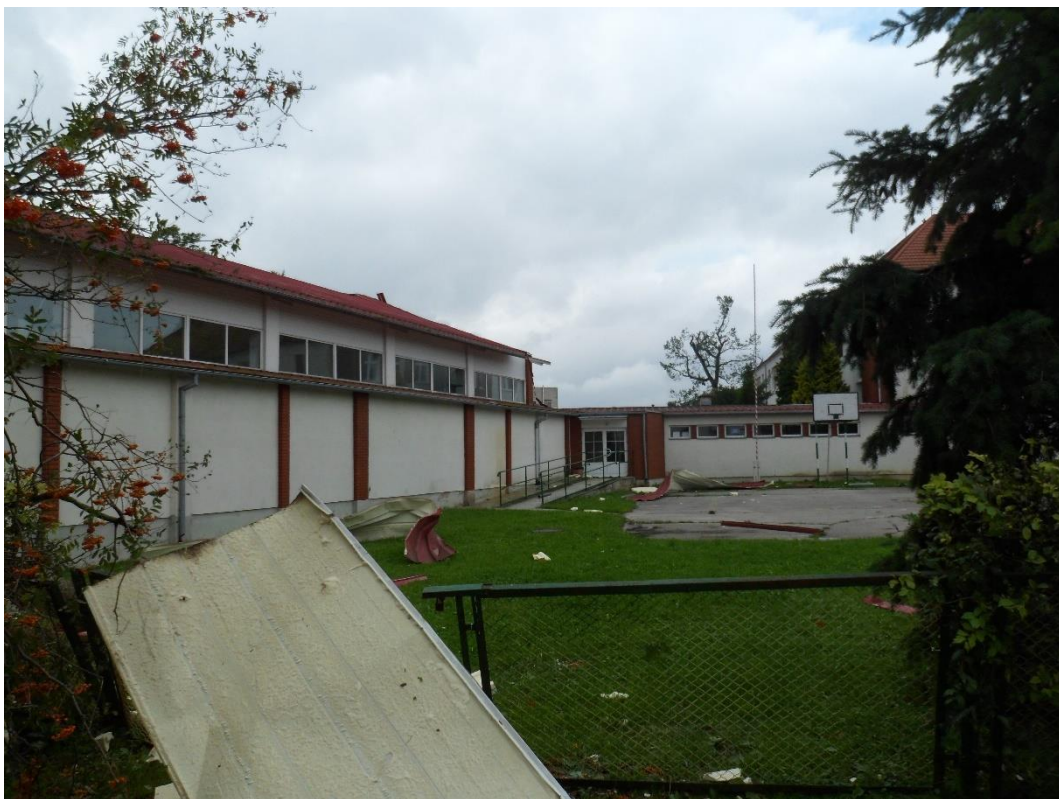
Zdjęcie 12. Stan po nawałnicy: zerwane poszycie dachowe z sali gimnastycznej w Sośnie