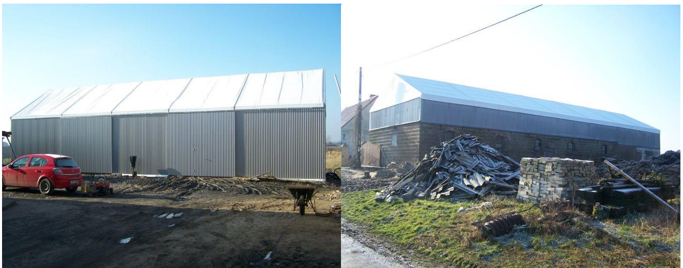
Zdjęcie 25. Odbudowany budynek gospodarczy oraz zmienione poszycie dachowe wraz z konstrukcją na chlewni