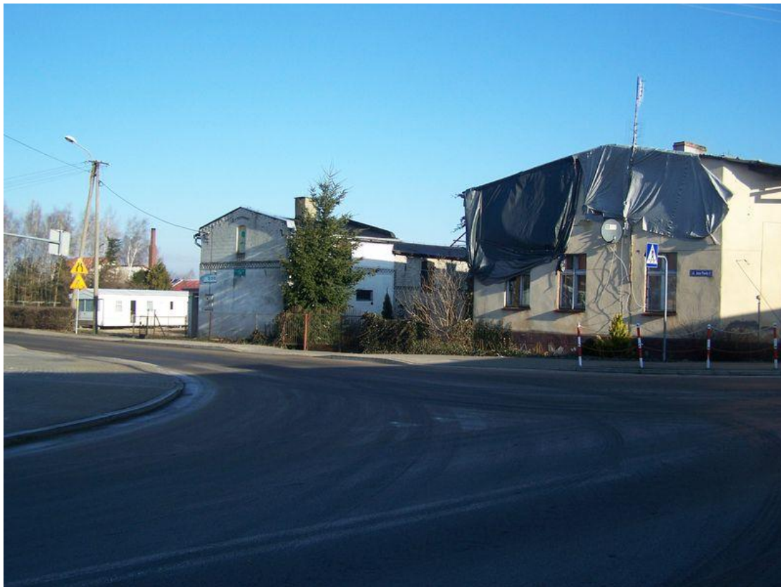
Zdjęcie 4. Stan aktualny: w głębi po lewej stronie mieszkania zastępcze w postaci domków holenderskich