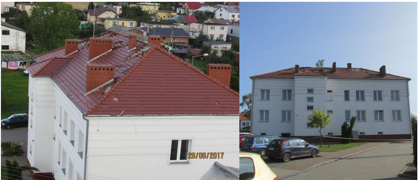
Zdjęcie 7. Stan po nawałnicy: zerwane poszycie dachowe