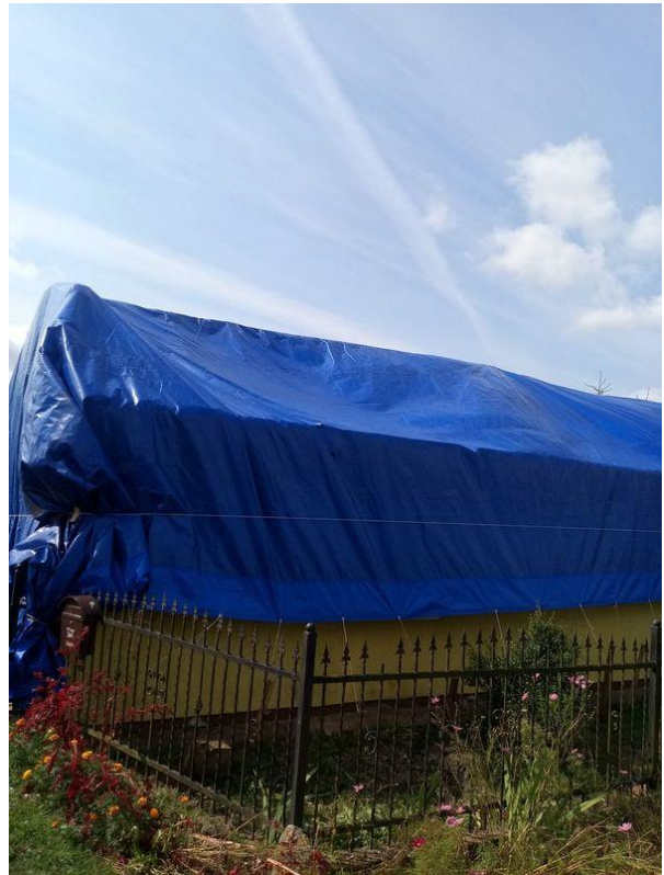
Zdjęcie 23. Stan po nawałnicy: zerwane poszycie dachowe oraz konstrukcja dachu